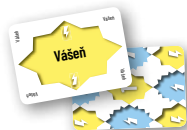
98 karet konceptů