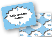
6 karet úkolů